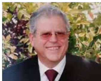
Vice-presidente da Direção Nacional APVG

As dores, as injustiças e as sombras aparecerão, certamente.